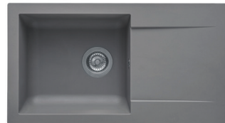
16 : GRIS BÉTON