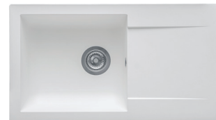
17 : BLANC UNI