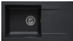
06 : NOIR PAILLETÉ