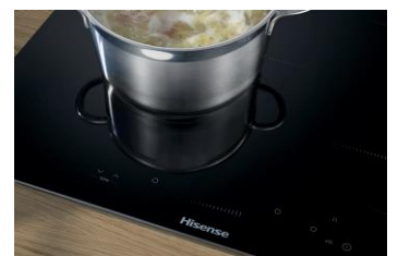
TABLE DE CUISSON À INDUCTION : HISENSE HI6311BSCE