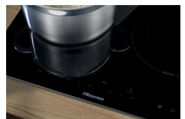
TABLE DE CUISSON HI-LIGHT : HISENSE E6322C